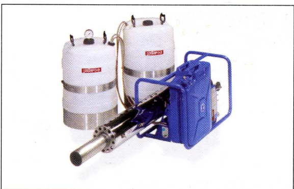
pulsFOG K-30/20 BIO , mali tubularni ram