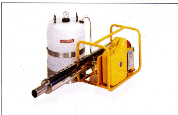
pulsFOG K-22/10/O , mali tubularni ram