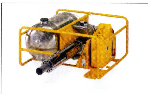
pulsFOG K-22/10/O , veliki tubularni ram