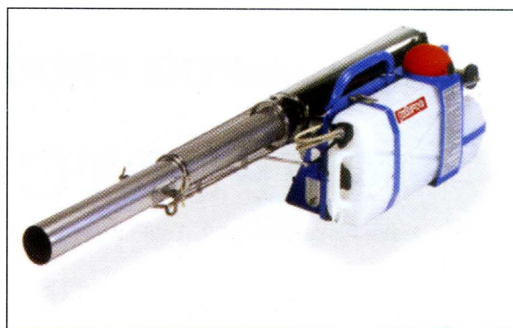
pulsFOG K-30/O , portabl